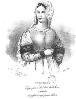
Trotula De Ruggiero (1050-1097 d.C)

Prosegue il nostro Viaggio nel tempo dal 370 d.C. con Hypatia di Alessandria a ...