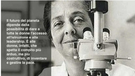
Rita Levi Montalcini ( 22-4-1909 / 30-12-2012)